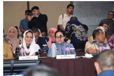
HLM Provinsi di hadiri oleh Bupati/ Walikota se Provinsi Maluku Utara