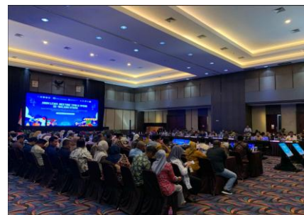
Suasana Rapat HLM yang bertempat di Ballroom Hotel Bella Ternate