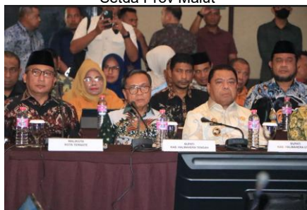
HLM Provinsi di hadiri oleh Bupati/ Walikota se Provinsi Maluku Utara